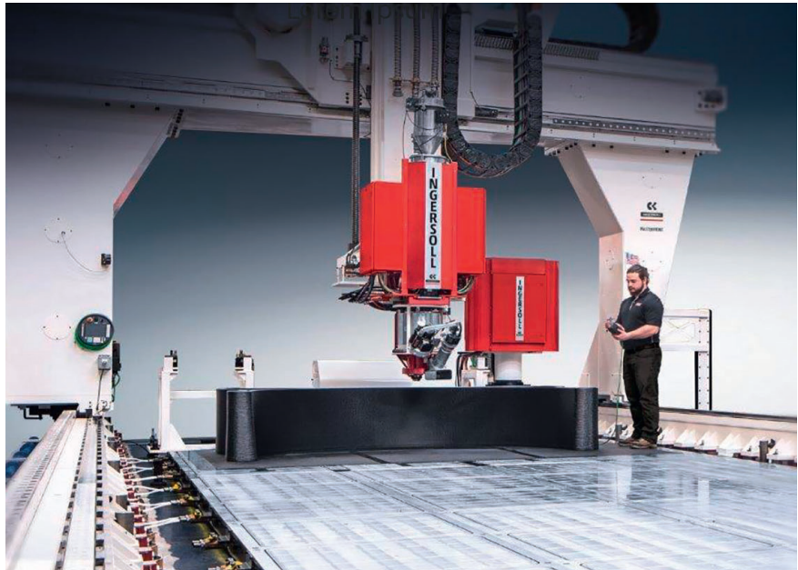
5 3D-Druck und Herstellung von CFK-Verbundwerkstoffen: Auf den MasterPrint und Mon-goose-Maschinen von Ingersoll laufen in rekordverdächtigen Dimensionen AFP (Automated Fiber Placement)-Prozesse ab