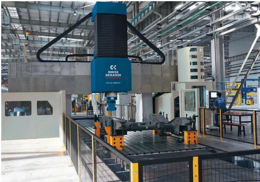
3 Hochgeschwindigkeits-Groß-Fräszentrum Atlas Vision P von Innse-Berardi: mit fahrbarem Tisch und feststehendem Portal

gegen hat sich zum Global Player im Bereich Verbundwerkstoffe, Additive Fertigung und Werkzeugmaschinen für die Luft- und Raumfahrtindustrie aufgeschwungen (siehe Kasten). Beide sehen ihre besondere Stärke in kundenspezifischen, schlüsselfertigen Lösungen. Das eigene Know-how und das der Kunden werden dabei zu ›Team-Key‹-Lösungen kombiniert, wie man bei Camozzi sagt.